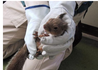
図-3 ニホンリスの行動調査 における捕獲調査