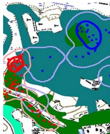
図-5 GISによる行動圏と植生の関係の解析 (色分け：植生タイプ、点：動物の活動地点)