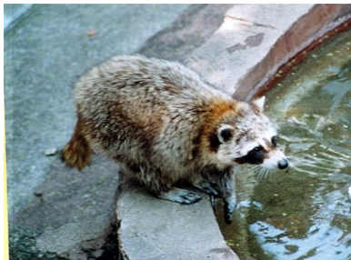
図-2 特定外来生物：アライグマ