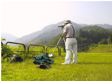
図-1 猛禽類定点調査

生態調査では直接観察法、食性調査、テレメトリー法、行動・利用環境調査などを行います。