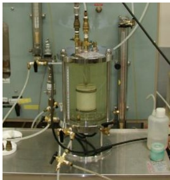
((財)電力中央研究所 所有機器) 図-2 変水位試験器