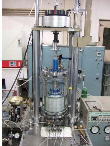
((財)電力中央研究所 所有装置) 図-4 土壌の中空ねじり試験装置

土壌の中空ねじり試験 対象試料 : 砂質土、粘性土等 試料寸法 : 外径200mm, 内径100mm, 高さ200mm 軸荷重・変位 : 20kN, 50mm 最大トルク : 20kN・cm セル圧 : 350 kPa