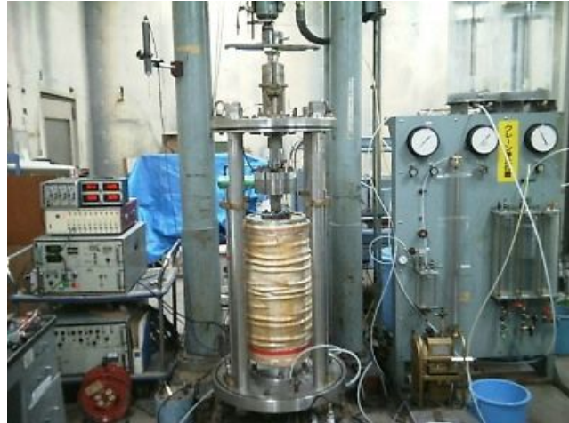
((財)電力中央研究所 所有装置) 図-5 大型三軸試験装置

土壌の中空ねじり試験 対象試料 : 砂質土、粘性土等 試料寸法 : 外径200mm, 内径100mm, 高さ200mm 軸荷重・変位 : 20kN, 50mm 最大トルク : 20kN・cm セル圧 : 350 kPa