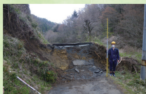
地表地震断層調査

発電所および原子力関連施設の健全性や原子力リスクに係る評価を支援するために、各種材料の物性評価試験や現地調査、実機構造物による実証試験を行っています。