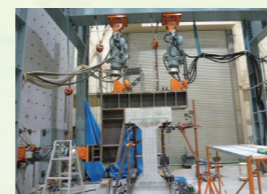
水路構造物の載荷試験 (電力中央研究所保有設備)