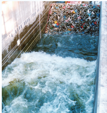
造波実験 (電力中央研究所保有設備)