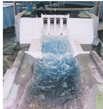
水理模型実験 (電力中央研究所保有設備)