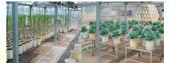
野菜・樹木の栽培試験 (電力中央研究所保有設備)