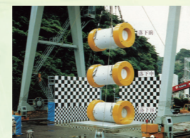
実機構造物の健全性実証試験