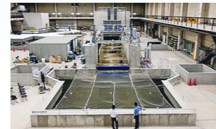
津波・氾濫流実験 (電力中央研究所保有設備)